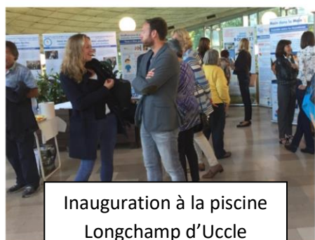
Inauguration à la piscine Longchamp d'Uccle