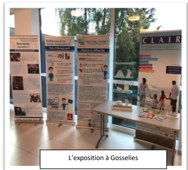
L'exposition à Gosselies

Promouvoir le dépistage précoce des maladies inflammatoires rhumatismales (polyarthrite, arthrite juvénile, spondylarthrite, lupus...) : l'exposition itinérante "main dans la main, ensemble contre les rhumatismes", vise à promouvoir un dépistage précoce de ces pathologies, dépistage qui permet d'éviter les handicaps qui se développent si les maladies ne sont pas traitées. Dans la polyarthrite rhumatoïde, plus vite on met en place un traitement efficace, plus élevées sont les chances d'éviter des déformations permanentes. Dans le lupus, on sait qu'un traitement rapide permet notamment d'éviter des graves séquelles aux reins ou au système nerveux.