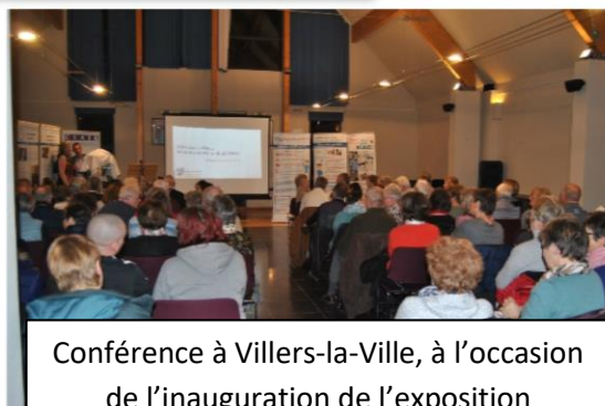
Conférence à Villers-la-Ville, à l'occasion de l'inauguration de l'exposition