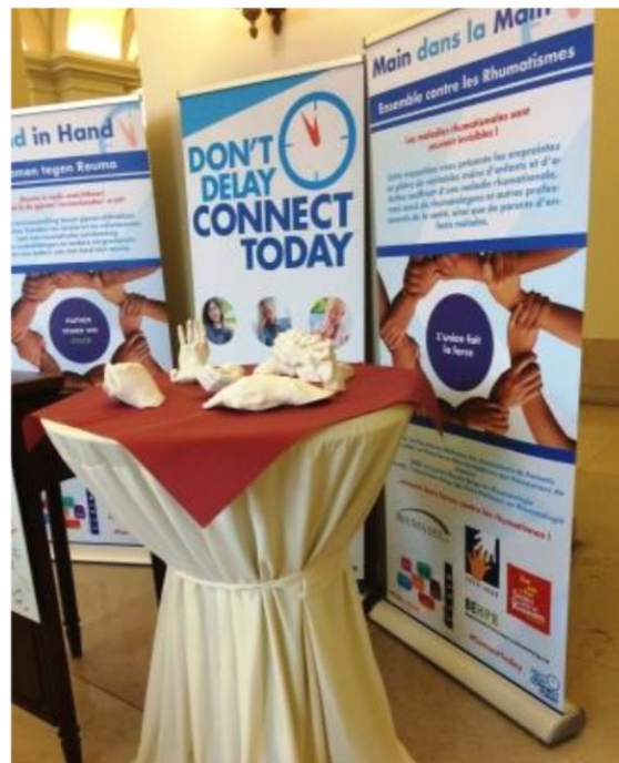
Inauguration au Parlement fédéral