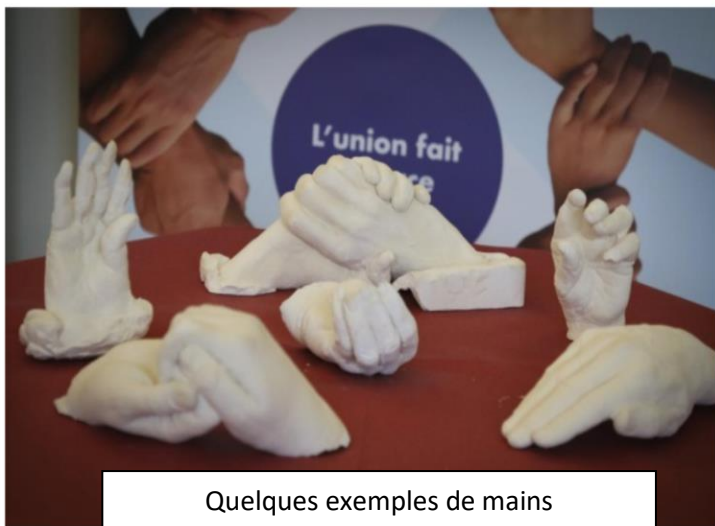
Quelques exemples de mains