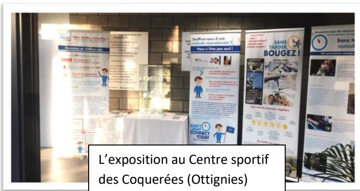
L'exposition au Centre sportif des Coquerées (Ottignies)